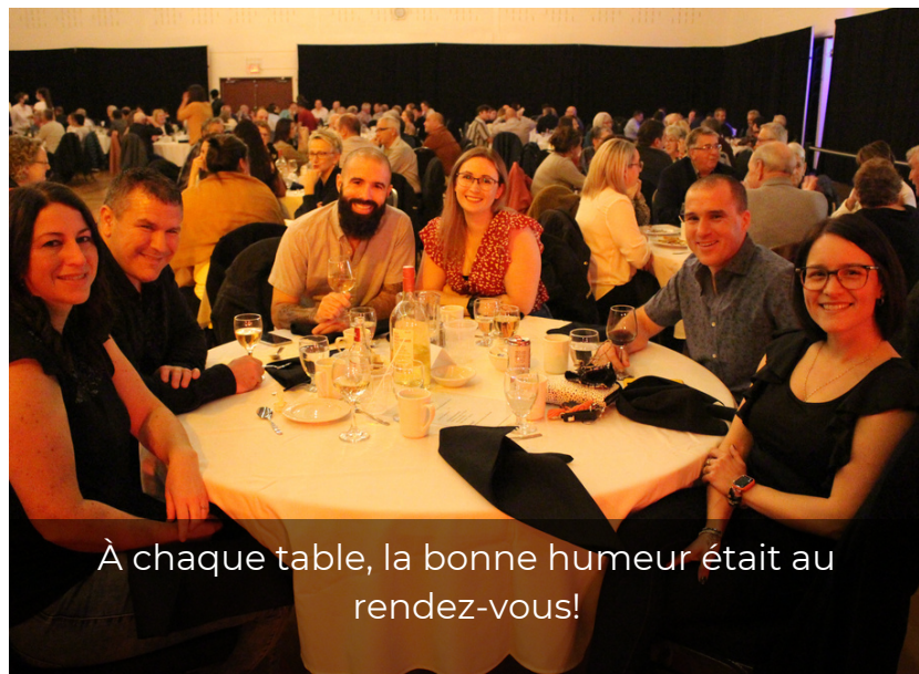
À chaque table, la bonne humeur était au rendez-vous!