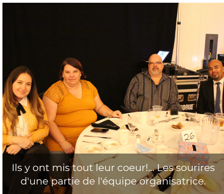
Ils y ont mis tout leur coeur!... Les sourires d'une partie de l'équipe organisatrice.