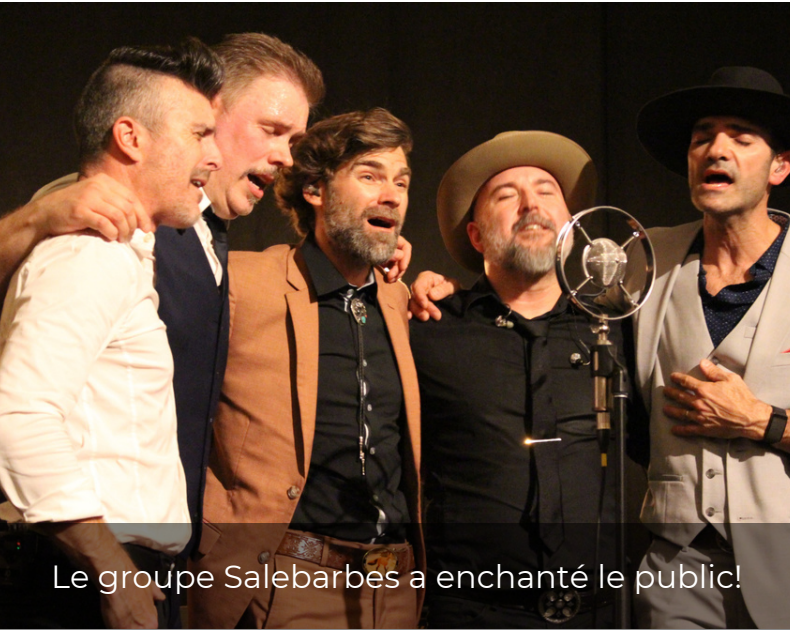
Le groupe Salebarbes a enchanté le public!