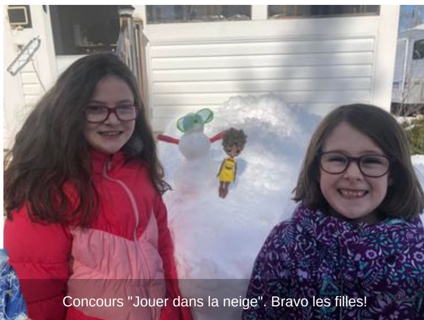
Concours "Jouer dans la neige". Bravo les filles!