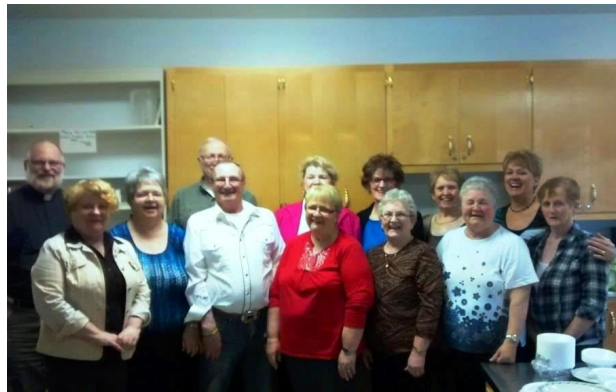
Membres du comité «Soups On» de Blackville

Le programme «Soups On» à Blackville a de beaux jours devant lui et pourrait bientôt s'avérer d'utilité publique, vu le succès qu'il remporte et qui grandit d'une année à l'autre. Peut-être pourrait-il également faire des émules en prêchant par l'exemple?